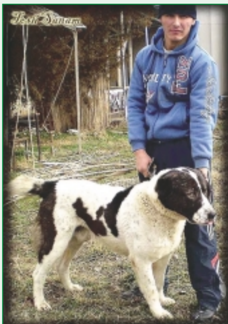
Typický predstaviteľ Strednej Ázie z Uzbekistanu

oblasti, vo Fergane, ale aj v Kurusae a Surchardarinskej oblasti. Mocné psy môžeme vidieť na hranici s Turkménskom v Parkente. Samozrejme, nemôžeme zabudnúť ani na Taškent - hlavné mesto Uzbekistanu, v ktorého okolí sa pravidelne usporadúvajú psie zápasy. Víťazi sú oslavovaní a ponuky na krytie sa majiteľovi len tak hrnú. Pred zápasmi sa odohráva váženie psov, čo nebýva v iných krajinách Strednej Ázie zvykom. Existuje aj ďalšia odlišnosť od okolitých krajín, a tou je, že agresívne psy, ktoré napadnú človeka, sa neutrácajú tak ako, napríklad, v Turkménsku alebo Tadžikistane. Tieto psy sa izolujú od ľudí a v každom prípade ich púšťajú do bojov s inými psami, aby potvrdili svoju chuť bojovať. Poranených psov zvyknú „bojčatníky“ (ľudia zaoberajúci sa bojmi) liečiť prírodným spôsobom, keď im rany zasypávajú popolom zo zhorenej ovčej plsti. Boje majú väčšiu vážnosť než výstavy. Miestni nie celkom chápu, prečo by mali svoje psy ukazovať a ešte si dokonca za to zaplatiť. Ak sa aj na výstavu nechajú nahovoriť, zväčša odmietajú fotografovanie svojich psov, pretože si myslia, že tým by mohli ich psy stratiť patričné bojové schopnosti. Samozrejme, netýka sa to všetkých majiteľov psov a ani chovateľov, ale ľudí s takým postojom je tu dosť.