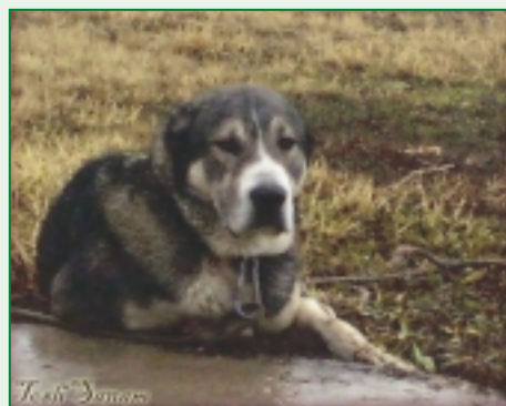
Pre kazašského tobeta je sivá farba typickým sfarbením