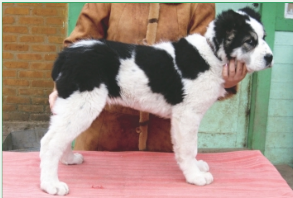
Malý 3 mesačný „uzbek“ - flakatý

V Kazachstane volajú stredoaziata tobetom. Tento názov sa odvodzuje od toho, že pastierske psy strážiace stádo si vyberajú najvyššie položené miesta, odkiaľ majú dobrý výhľad. Tobe-cholm znamená vyvýšenosť (strop), Tobege-iti je zase pes na vrcholci pahorku. Tobet teda znamená „nachádzajúci sa vrcholci“ a v kazašskom jazyku je to fakticky pes. Neraz sa môžeme stretnúť s pomenovaním