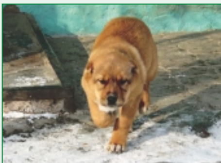
Malý kazašský tobet hrdzavej farby. Jedna z charakteristických farieb tobeta.