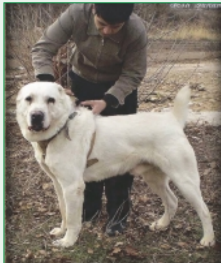
Veľmi pekný typický pes z Uzbekistanu strednej konštitúcie

mi ľuďmi, a tak si mohli do svojho chovu zapojiť takých psov, ako bol Čaban, Simba, Orlan, Akela a ďalší, ku ktorým sa bežní ľudia nedostanú. Uzbecká kynológia má určite na čom stavať a má ešte jedno veľké plus v tom, že táto krajina je členom FCI a vydáva riadne exportné rodokmene. A tie kupujúci dostávajú hneď so šteňatom na rozdiel od ruských a ukrajinských nezvyčajných praktík, keď nový majiteľ neraz čaká na preukaz pôvodu niekedy aj rok.