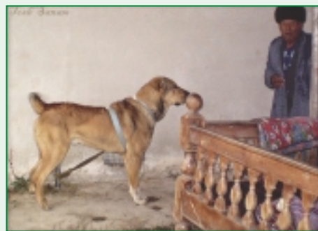
Krásny typický predstaviteľ pôvodného stredoaziata vo svojej domovine so svojim pánom.

Kirgizi a Kazachovia udržiavajú medzi sebou pomerne čulý kontakt a dokonca organizujú spoločné psie zápasnícke turnaje, kde proti sebe súperia. To, či vyhrá družstvo jedno alebo druhé, ani nie je tak dôležité, ako to, že sa stretnú kynológovia - priatelia, ktorí na týchto zápasoch objavujú vždy niečo nového, a hlavne tu nachádzajú psy, ktoré sú dostatočne preverené na to, aby ich mohli zapájať do svojho chovu. Stredoaziati v Kirgizsku, tak ako sme tu už veľakrát konštatovali, musia v prvom rade plniť dobre svoje pracovné úlohy a mať k tomu zodpovedajúcu povahu, exteriér je druhoradý, i keď kirgizskí chovatelia musia myslieť aj na túto stránku. Z nášho pohľadu a z informácií, ktoré sa k nám dostali prostredníctvom kirgizských chovateľov alebo internetových stránok, sa súčasné psy Kirgizska ničím výnimočným neodlišujú od populácie stredoaziata v iných krajinách Strednej Ázie. Nájdem tu psy rôzne - kvalitné, i menej kvalitné, ale dôraz na povahu a pracovné schopnosti zostáva, a tým sa zatiaľ miestna populácia radí v rámci nášho plemena k tomu lepšiemu na rozdiel od krajín, kde sa dáva do popredia výlučne exteriér, ktorý navyše nie vždy zodpovedá skutočným požiadavkám pre stredoaziata. Kirgizsko je pomerne chudobná krajina a prepych si tu obyvatelia nemôžu