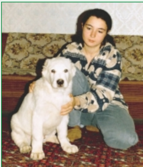
Malý 3 mesačný „uzbek“ bielej farby

Kirgizi, vlastným menom Kyrgyz, po starom Karakirgizovia, patria etnicky do tej istej skupiny ako Kazachovia, ktorých v podstate zahrňovali aj pod svojim názvom až do roku 1924 - to znamená, že do tej doby existoval pre tieto dva národy len jeden názov, a to Kirgizi. Populácie stredoaziátov sa v tejto krajine vyskytovali tak ako v iných oblastiach Strednej Ázie - oddávna, spolu s chrtmi, ktoré sa nazývajú tajgan. Pre miestnych psov tu bol voľakedy názov kirgizský vlkodav, ktorého