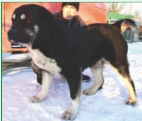
Pes menom Turtkuz v ktorom koluje krv vynikajúceho zápasníka Tajsona. Meno má také aké je jeho farba (turtkuz, alebo čorčašma)

tmavé farby typické pre kazašského vlkodava - tobeta. Biele, čierno-biele, čierne, tigrované, skrátka celá škála farieb. Chovateľská stanica Ak-Bosar ponúka biele šteňatá po bielych rodičoch. Tiež v chovateľských staniách Karaganda-Alabaj alebo Klub Lider It môžeme vidieť všetky možné farby, a tak sa zdá, že na čas na pravého „tobeta“ si budeme musieť ešte počkať. Veď kto iný by mal s chovateľskou aktivitou začať, ak nie Kazachovia sami?