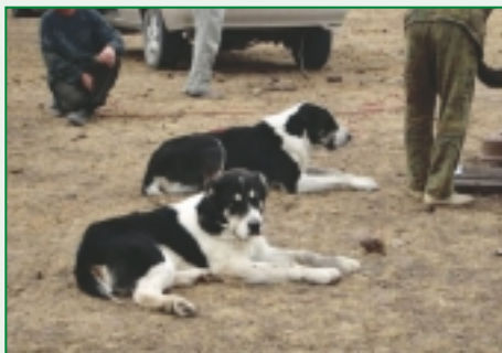
Kazachstan - štvoroké psy

kazašský vlkodav, a čo je zaujímavé, volajú ho tak niekedy aj v Uzbekistane. Kožachmetov spolu s Malaševičom opisujú kazašského vlkodava (tobeteta), a pri tomto opise nachádzame veľmi veľa spoločných znakov so stredoaziatskimi inými oblasťami Strednej Ázie. Je zrejmé, že opisujú v podstate stredoaziata, ktorý je typickým predstaviteľom týchto psov nielen pre Kazachstan. Môžeme vidieť síce aj isté odlišnosti, a to najmä vo farbách, ale inak zásadných rozdielov niet.