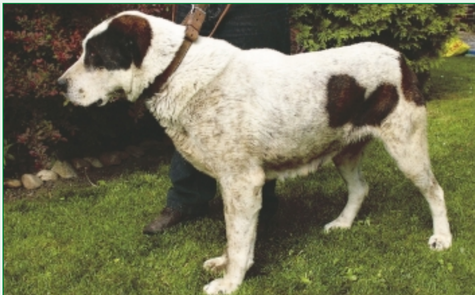
Veľmi pekná suka z Kirgizska nesúca krv turkménskeho Maša a turkménskeho Sachara

O pomenovaní turkménsky alabaj hovoria, obdobne ako E. Myčko, že ide o reklamný trik, či obchodnú značku. „Alabaj“ je len meno pre psa, ktoré sa často používa, tvrdia v zhode s viacerými kynológmi a chovateľmi Strednej Ázie. Neprináleží nám robiť sudcov ohľadom