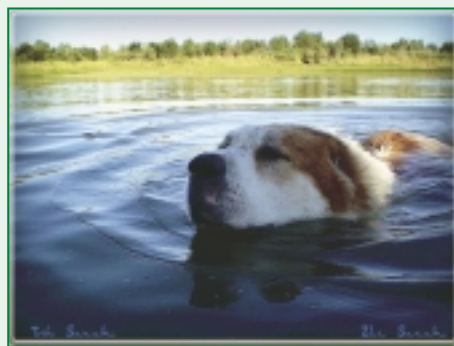
syn importovaného turkménskeho psa Simbu do Uzbekistanu nám ukazuje, že vie plávať, hoci stredoaziati na to vo svojej domovine veľa možností nemajú.