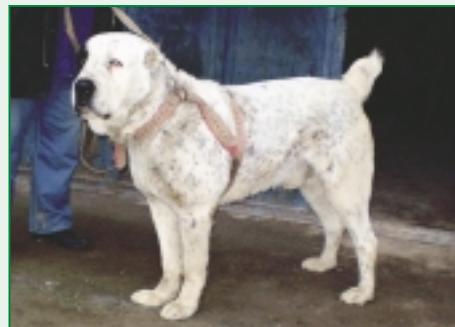
Turkménsky výborný pes importovaný do Uzbekistanu, potvrdzuje, že Uzbekovia dovážajú psy vysokej kvality

dovoliť - a vlastniť pekného psa, ktorý nespĺňa svoj účel, by prepychom určite bolo. Napriek tomu, že to s našou témou až tak nesúvisí, dovolím si spomienku na jedného vynikajúceho spisovateľa a človeka, ktorý sa v tejto krajine narodil a vo svojich knihách nám priblížil život tunajších ľudí ako i prekrásnu prírodu, a tým je Čingiz Ajmatov. Pravda, o našich „azia-toch“ sa v knihách veľa nepíše, ale na druhej strane prečítané knihy tohto spisovateľa boli nielen veľkým zážitkom, ale dobre poslúžili na lepšie pochopenie ľudí žijúcich v Strednej Ázii, kde má pôvod náš stredoaziat.