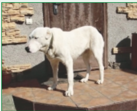
Stredoasiat belej farby z Kazachstanu